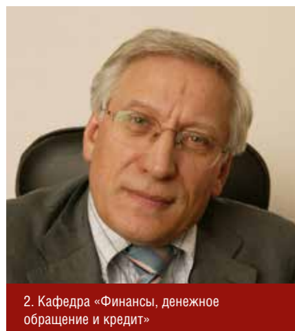
2. Кафедра «Финансы, денежное обращение и кредит»

д.э.н., профессор Заведующий кафедрой Сертифицированный аудитор Член Европейской Ассоциации Учета (ЕАА)