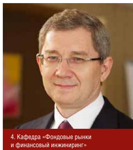
4. Кафедра «Фондовые рынки и финансовый инжиниринг»