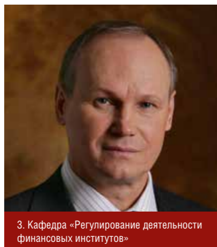
3. Кафедра «Регулирование деятельности финансовых институтов»