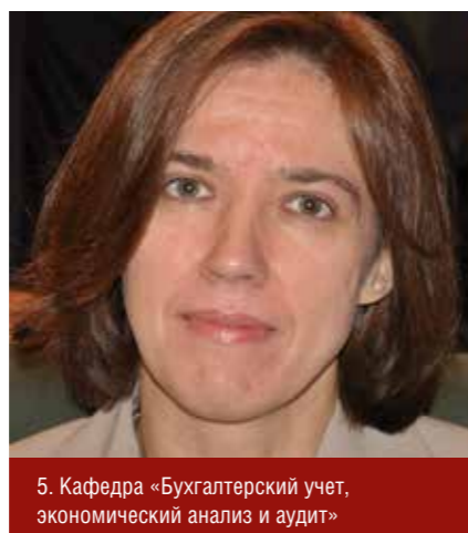
5. Кафедра «Бухгалтерский учет, экономический анализ и аудит»

60% программы – обучение широкого управленческого профиля, 40% – функциональное обучение